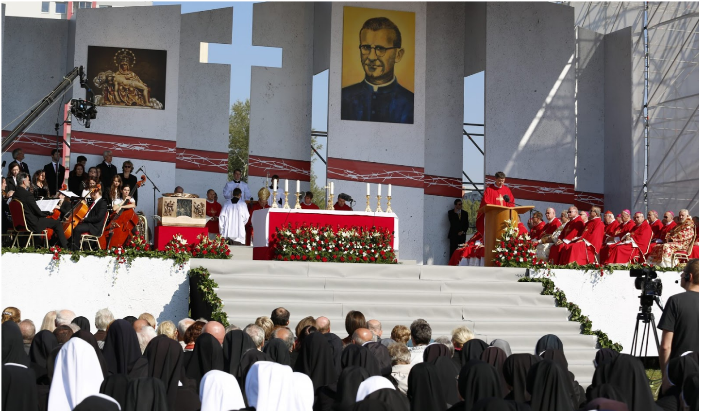
Zo slávnosti blahorečenia Titusa Zemana v Bratislave 30. septembra 2017.

Časopis veriacich RKC farnosť Hniezdne s filiálkami Forbasy a Kamienska 15.-16.6.2018