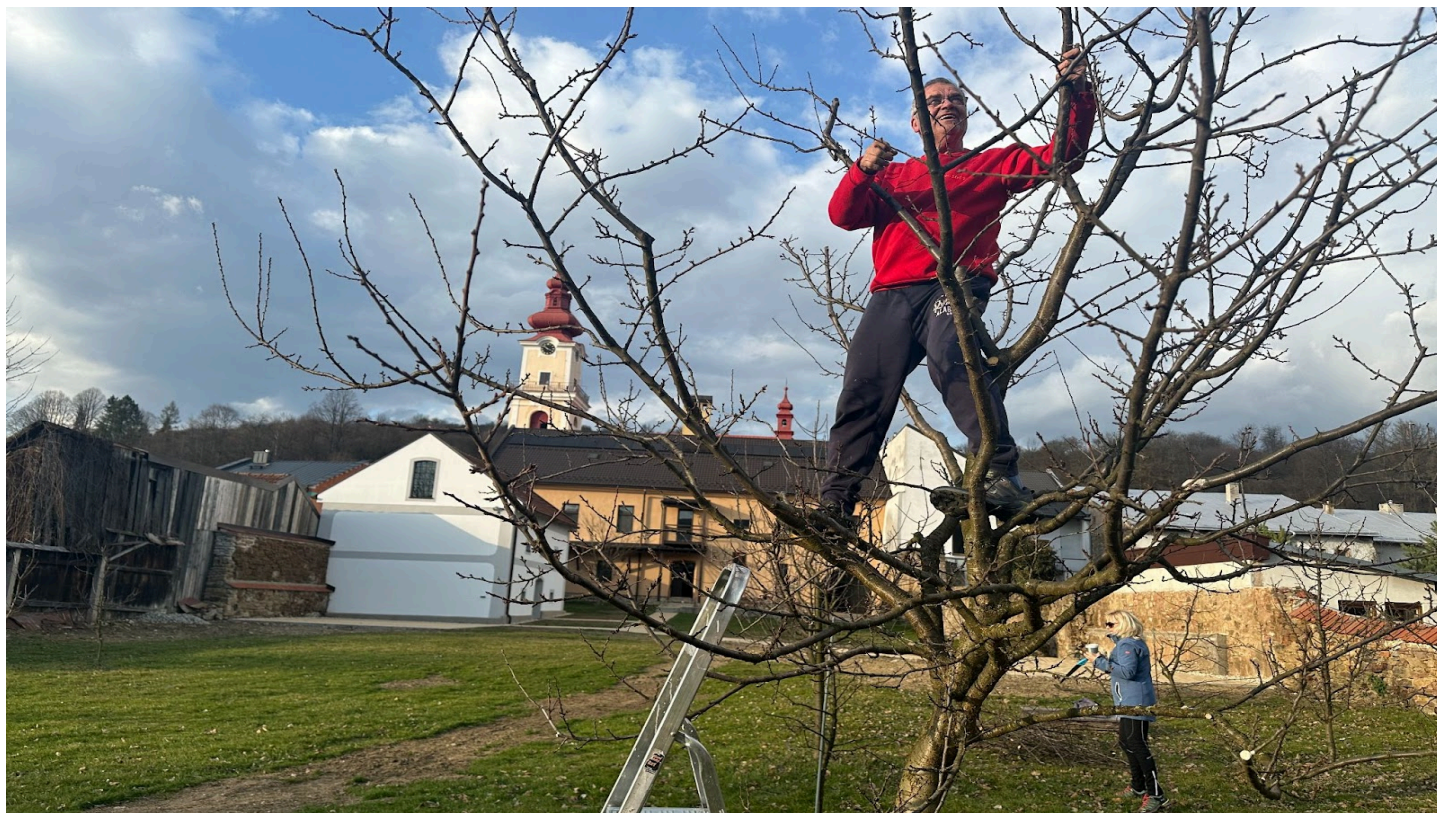
Jarné orezávanie stromov, tento rok zásadné, aj s pomocou špecialistu z Liptova. Ďakujeme :)